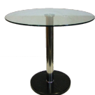
Bestell-Nr. 23 Tisch rund, Ø 70 cm, Höhe 76 cm Mietpreis pro Stück: € 39,00